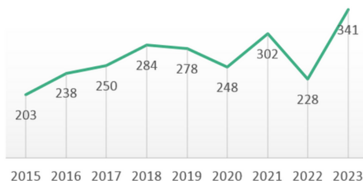
Évolution du nombre d'adhérents

Le montant de l'adhésion simple est fixé à 34€, 40€ pour les couples, 15€ pour les bénévoles et 50€ pour les personnes morales. Le nombre d'adhérents ne reflète pas l'activité de l'Association.